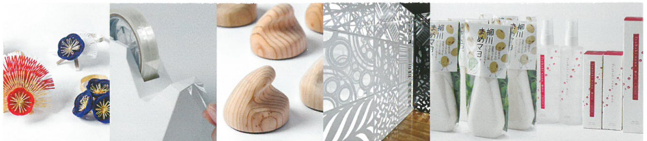
2016大賞 博多水引ボトルリボン

Tel 092-643-3591 / Fax 092-643-3226 / E-mail design-2@fida.jp